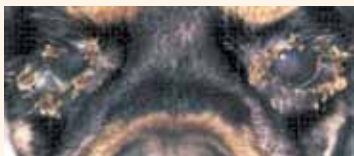
KCS 치료 1일

옵티문은 정상눈물 분비를 회복시키고, 항염증 작용으로 통증을 완화시켜 애견이 편안하게 해줍니다. 유일한 애완견용 KCS 치료제입니다.