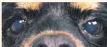
KCS 치료 63일