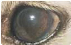
양적 눈물부족으로 윤기없는 각막