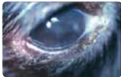
점액농성에서 화농성의 분비물